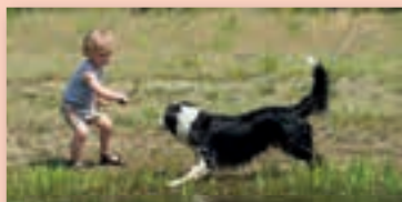
Overijssel; fantastisch en gemoedelijk!