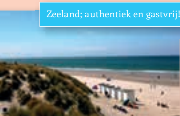
Zeeland; authentiek en gastvrij!