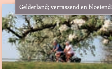
Gelderland; verrassend en bloeiend!