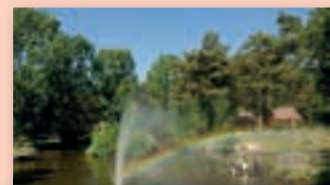
Limburg; onvergetelijk en mooi!