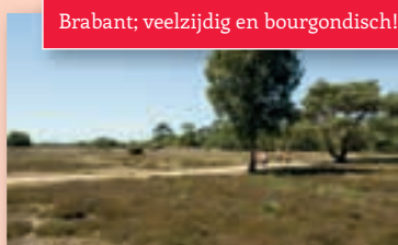
Brabant; veelzijdig en bourgondisch!