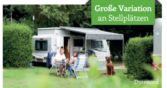
Große Variation an Stellplätzen