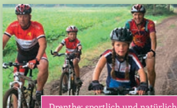
Drenthe; sportlich und natürlich!