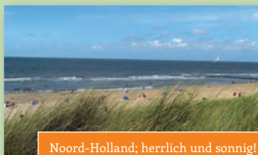
Noord-Holland; herrlich und sonnig!