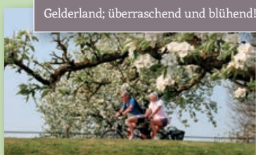
Gelderland; überraschend und blühend!