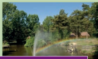
Limburg; unvergesslich und schön!