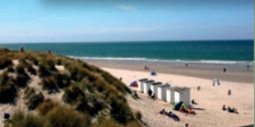
Zeeland; authentisch und gastfreundlich!