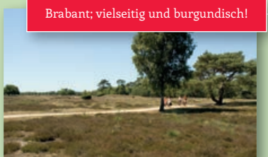
Brabant; vielseitig und burgundisch!