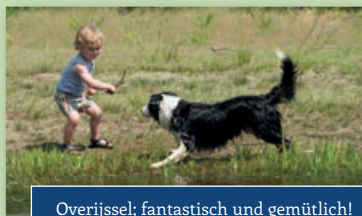
Overijssel; fantastisch und gemütlich!